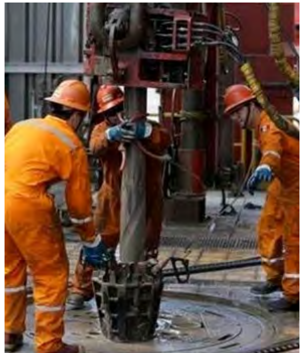
Trabajos en una plataforma marítima de Pemex, cerca de las costas de Veracruz.

Ojalá que lo establecido en el nuevo Reglamento de Trabajo para el Personal de Confianza, en materia de revisión salarial, se haga extensivo – como ha ocurrido en otras ocasiones– a los jubilados de confianza.